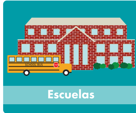
Escuelas (todos los niveles, desde preescolar hasta la universidad, también escuelas profesionales y escuelas técnicas.)