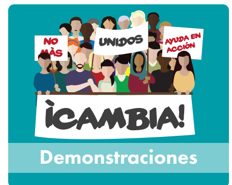
Durante una marcha, reunión, desfile u otra demostración pública