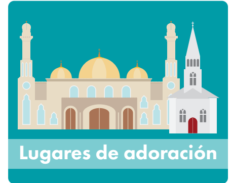
Lugares de adoración o edificios alquilados para servicios religiosos