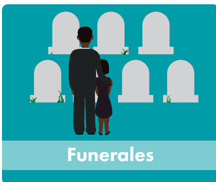
Ceremonias religiosas públicas, tales como funerales