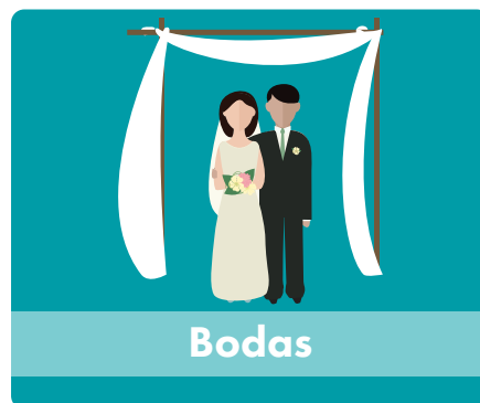
Ceremonias religiosas públicas, tales como bodas