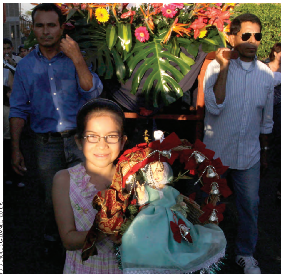
NIÑA SOSTIENE FIGURA DE CRISTO DURANTE PROCESIÓN DE LOS SANTOS INOCENTES EN EL SALVADOR — Una niña sostiene una figura de Cristo durante una procesión tradicional celebrando la fiesta de los Santos Inocentes en Antiguo Cuscatlán, El Salvador, el 28 de diciembre. El evento recuerda los niños masacrados en Belén por Herodes en su intento de destruir al Niño Jesús.