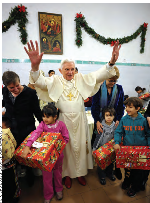
EL PAPA BENEDICTO ENTREGA REGALOS A NIÑOS — El Papa Benedicto XVI saluda después de entregar regalos a niños durante su visita a la cocina caritativa de la Comunidad de San Egidio, en Roma, el 27 de diciembre.